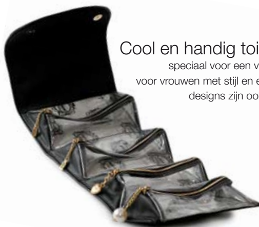
Cool en handig toilettasje van Antichic , speciaal voor een vrouw van de wereld. Antichic dat een statement voor vrouwen met stijl en een uitgesproken smaak verzorgt. Naast de designs zijn ook de voeringen en gimmicks volledig vernieuwd.