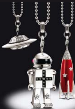
Nadat de verbondenheid met al het aardse is bewezen, maakt Thomas Sabo zich er ook klaar voor om hogere sferen te veroveren met spacejuwelen, waarvan de inspiratie rechtstreeks uit de omloopbaan lijkt te komen. De Sterling Silver Collection.