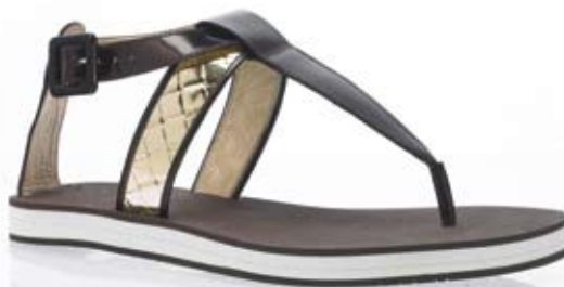
Soepele sandaaltjes van Santoni , uiteraard in een nieuw zomers jasje. Prachige kleurcombinaties met hier en daar een bronskleurig accent.