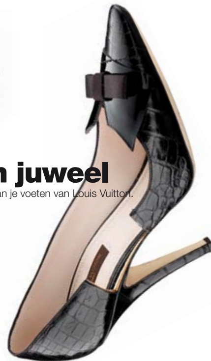
voor aan je voeten van Louis Vuitton.